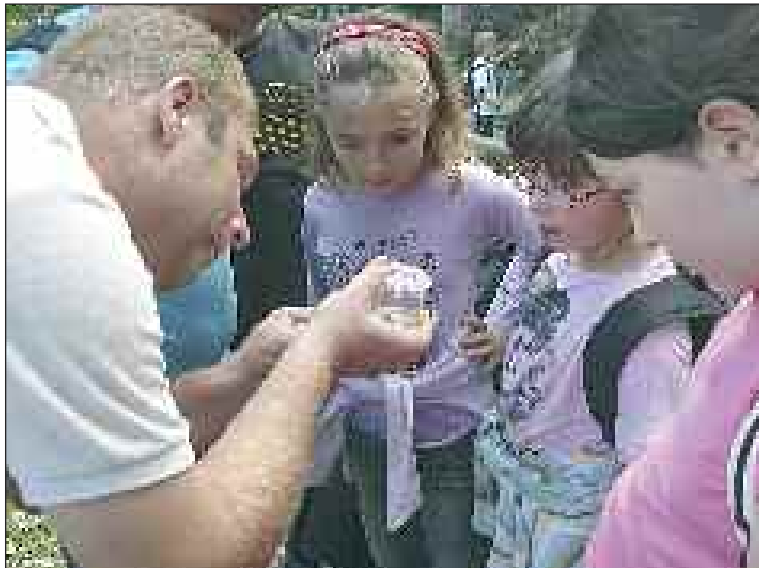
Première leçon : observons les têtards à la loupe !