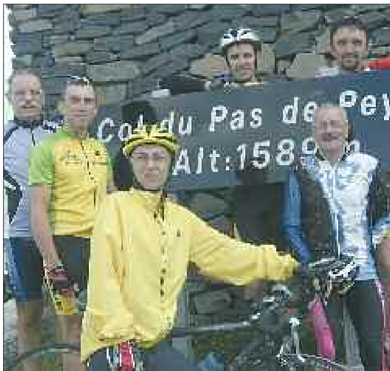
Les six Salignacois au sommet du Pas de Peyrol (puy Mary)

Assemblée générale. Elle aura lieu le jeudi 30 septembre à 20 h 30 dans une salle de la mairie. Toute personne souhaitant s'impliquer dans la vie de l'association ou pratiquer le cyclotourisme est la bienvenue.